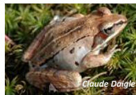
Grenouille des bois ( Lithobates sylvaticus )