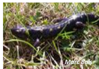
Salamandre maculée ( Ambystoma maculatum )