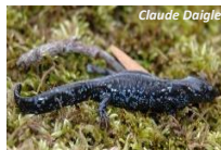
Salamandre à points bleus ( Ambystoma laterale )