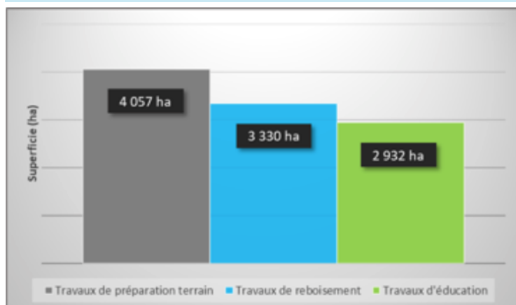
Répartition de la superficie des traitements sylvicoles non-commerciaux pour la saison 2020-2021

Pour la saison 2020-2021, une somme de 2,18 M $ a été investie en travaux de voirie pour les chemins multiusages par différents programmes du MFFP dans les UA de la région.